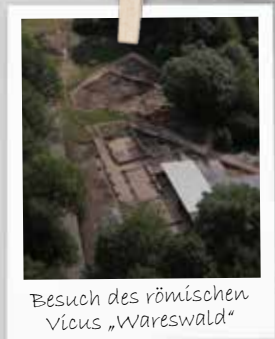
Besuch des römischen Vicus „Warenswald“