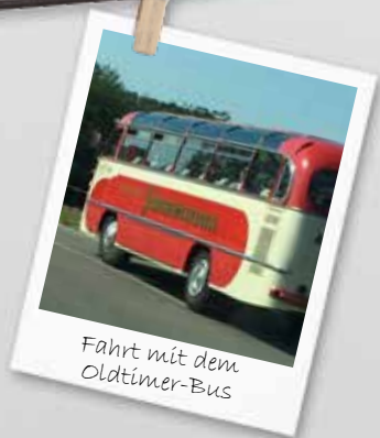
Fahrt mit dem Oldtimer-Bus