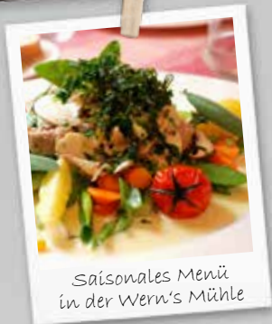
Saisonales Menü in der Wern's Mühle