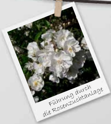
Führung durch die Rosenzuchtanlage