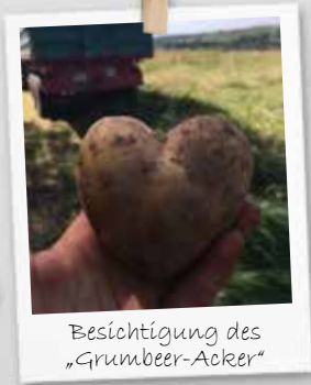
Besichtigung des „Grumber-Acker“